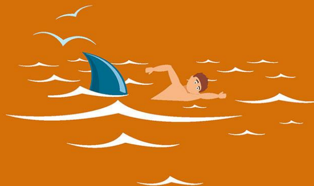
Nadar con un tiburón es un riesgo